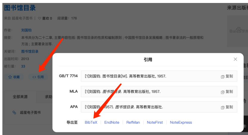
图 1-2 使用学术搜索查找文献引用代码

1 @book{刘国钧1957图书馆目录, 2 title={图书馆目录}, 3 author={刘国钧}, 4 publisher={图书馆目录}, 5 year={1957}, 6 }