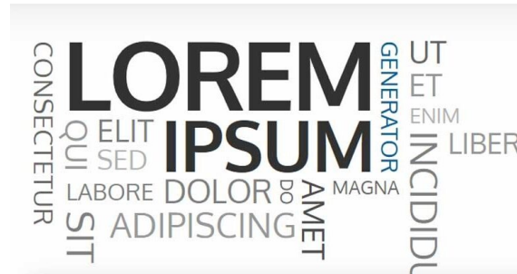
Figura 1.1: Maecenas viverra convallis sem, id imperdiet neque rhoncus et. Ut vel mi erat. Nam quam arcu, mollis sodales felis at, sagittis iaculis lectus.

Vestibulum tristique dapibus arcu porta euismod. Ut bibendum at nunc et interdum. In egestas pretium lacus, ut aliquet ipsum ultrices quis. Morbi euismod justo arcu, consequat sagittis orci aliquam in. Vivamus dignissim, libero vel accumsan viverra, odio erat venenatis sapien, a gravida quam neque vitae nisi.(MINISTÉRIO DE MINAS E ENERGIA – MME. e EPE (2020)).